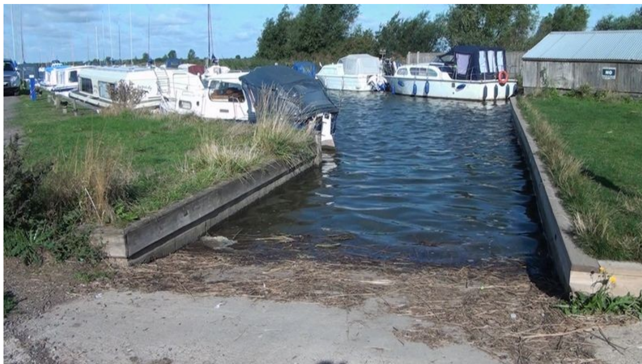
Dajk v Bureside

S paní správcovou jsme domluvili kromě místa na spaní ještě ukotvení piráta v blízkém dajku 1 a postavili si stan.